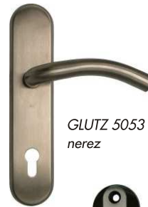
GLUTZ 5053 nerez