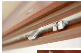
Střelka a jazýček zámku