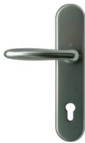
VERONA F1 elox. hliník, bez překrytí cylindru

Kliky HOPPE – provedení klicka-klicka, klicka-koule