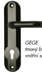
GEGE tmavý bronz vnitřní strana