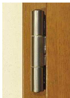
Závěs BAKA PROTECT 3D