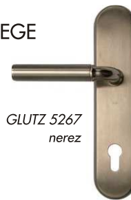
GLUTZ 5267 nerez