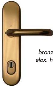
PARIS bronz F4 elox. hliník