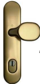
bronz F4, elox. hliník