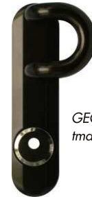
GEGE tmavý bronz